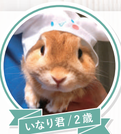
いなり君 / 2歳