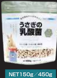
NET150g / 450g